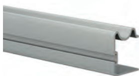
• PPTPGA2/ • PPTPG2